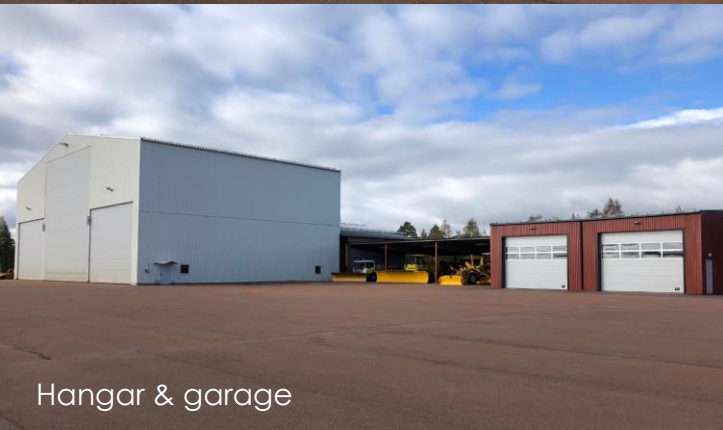
Hangar & garage

Under perioden 2015-2016 lät fastighetsägaren, Mora kommun, bygga ut med c:a 1900 m 2 för inrymmandet av Svensk Luftambulans (SLA) verksamhet samt ny avgångshall. Frånsett lokaler för SLA samt hangaryta, som hyrs ut till relaterad verksamhet, så nyttjar Dalaflyget samtliga lokaler.